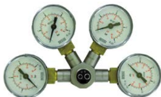
Imagen de referencia (no exacta)