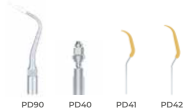
PD90 PD40 PD41 PD42