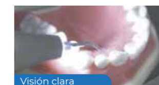
Visión clara D600 con luz LED

La pieza de mano con LED utiliza la última técnica de sellado y puede ser autoclavable. Los pacientes se sienten más cómodos durante el tratamiento.