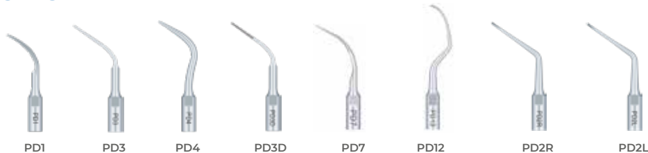
PD1 PD3 PD4 PD3D PD7 PD12 PD2R PD2L