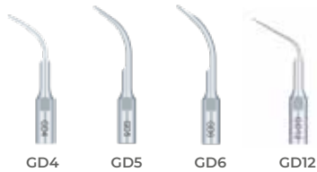
GD4 GD5 GD6 GD12