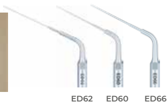
ED62 ED60 ED66